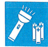
Flashlight · Batteries