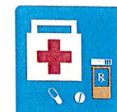
First Aid · Meds