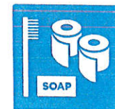
Personal Care Kit